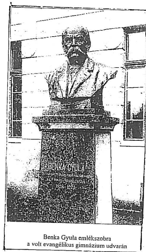
Benka Gyula emlékszobra a volt evangélikus gimnázium udvarán

A magyar nemzeti kultúra intézményei szolgálatában eltöltött munkálkodása nemcsak a főhatóság, hanem a király figyelmét is magára vonta. Ezért Benka Gyulát szolgálatának negyvenedik esztendejében a király a Ferenc József-rend lovagkeresztjével tüntette ki, amelyet 1902. június 17-én a szakminisztérium részéről dr. Lukács György főispán tűzött az ünnepelt mellére a főgimnázium zsúfolásig megtelt tornacsarnokának ünnepelő közönsége előtt. E szavak kíséretében: „Kívánom, hogy a Mindenhatónak annyi áldása szálljon ősz fejére, ahány művelt magyar hazafit ő édes hazánknak felnevelt. Viselje mélyen tisztelt igazgató úr, Ő Felsége legmagasabb kegyelmének kitüntető jelvényét, viselje nagyon sokáig, viselje egészségben és boldogságban „..” Benka Gyula a szarvasi Ótemetőben pihen.