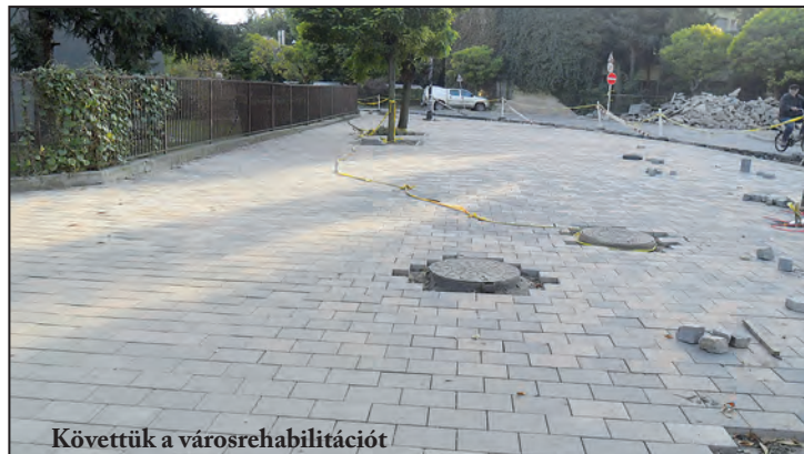
Köveztük a városrehabilitációt