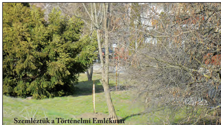
Szemléztük a Történelmi Emlékutat