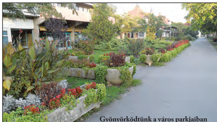
Gyönyörködtünk a város parkjaiban