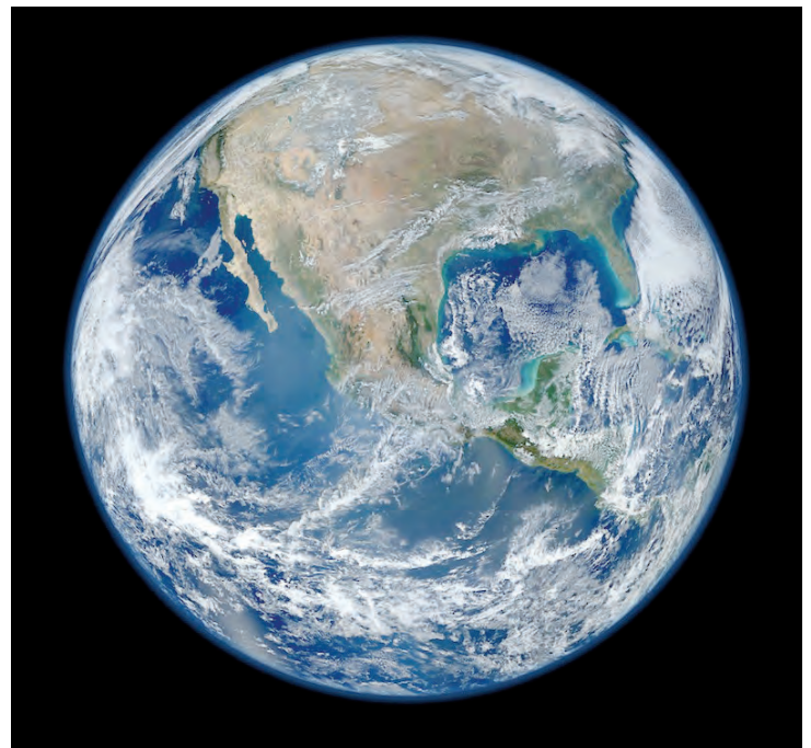
Bolygónkról készült felvétel a világűrből