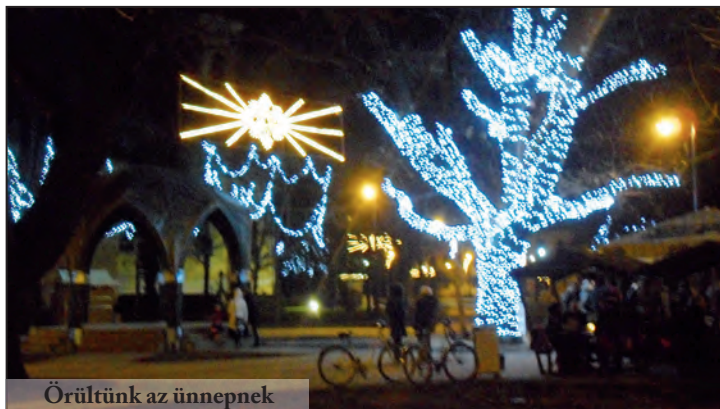
Örültünk az ünnepnek