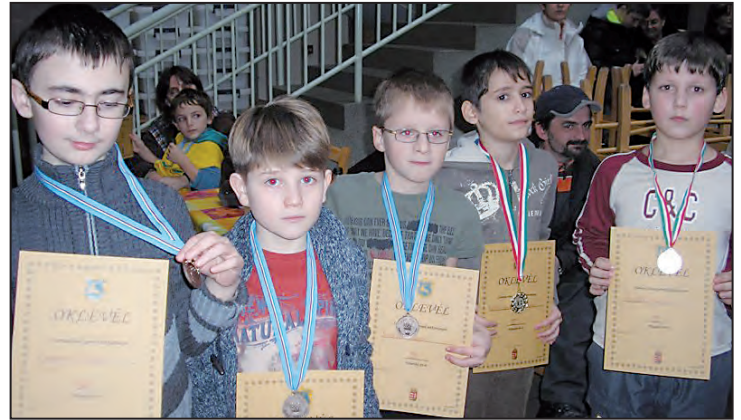
A II. korcsoportos fiúk eredményhirdetése

Hagyományosan az újesztendő első helyi rendezvényei közé tartozik a városi egyéni korcsoportos sakk diákolimpia, amelyet múlt szombaton rendeztek meg a Szlovák Általános Iskolában, 28 fiatal részvételével. A korcsoportok győztesei a megyei fináléban folytathatják.