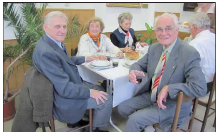
Jóval túl a kilencvenen