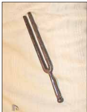
Hangvillája, amit mindig magánál tartott