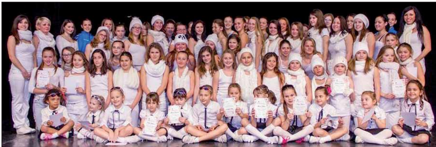
A gála záró momentuma.

Ezek a bluegymes lányok minden évben kitalálnak valamit. A legnépesebb helyi bejegyzésű aerobik egyesület vezetői, edzői és versenyzői, karácsonyhoz közeledve rendre a Vajda Péter Művelődési Központban tartják évbúcsúztató gálájukat. Idén először a Cervinus Teátrum adott otthont a rendezvénynek, e sorok írója azonban talán székre pontosan a tavalyi helyén szemlélte végig az impozáns műsort. A kis „turpisság” természetesen a létesítmény névváltásának köszönhető, mint ahogy az esztendő alatt szinte a Blue Gym