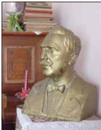
Egy dalostárs által készített szobra