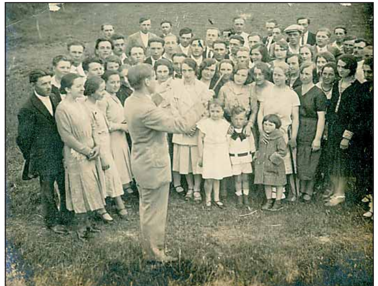
A Világosság Dalkör Halászelken 1932. május 1-jén