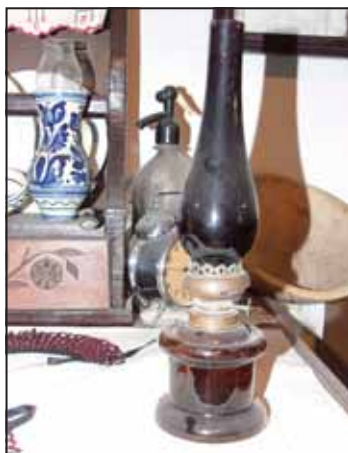
Piros burájú petróleumlámpája, melyet a fotók előhívásánál, a sötétkamrában használt