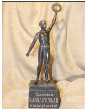
A Protestáns Leánykar adománya