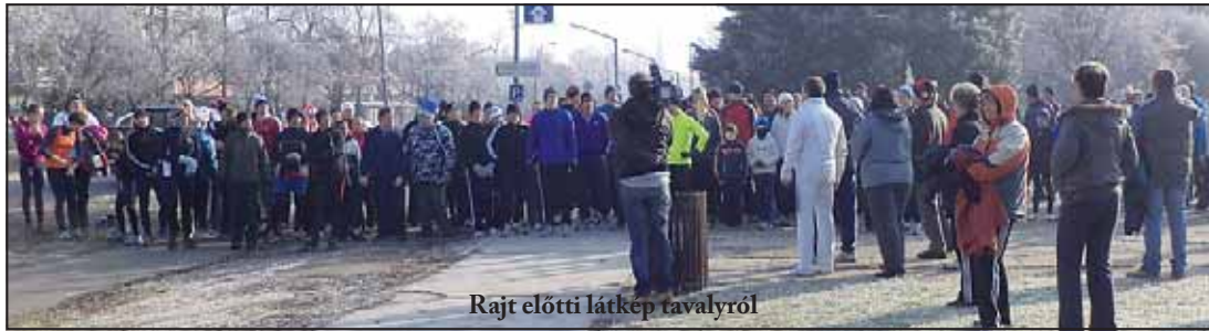
Rajt előtti látkép tavalyról

Az év utolsó napján idén is megtartják Szarvason a szilveszteri futógálát. Az érdeklődőket reggel 9.30 órától várják a Petőfi utcai sportszarnok elé, ahol a nevezés mellett bemelegítésre is lehetőség nyílik az indulás előtt. A szervezők arra kérnek mindenkit, hogy lehetőség szerint az alkalomhoz illő ruházatban, jelmezzel, illetve kellékekkel, hogy ezzel is hangulatosabbá varázsolják az összejövetelt. A résztvevőknek 2800 métert kell majd teljesíteniük a délelőtt 10 órai rajtot követően, a célban pedig csokoládé és