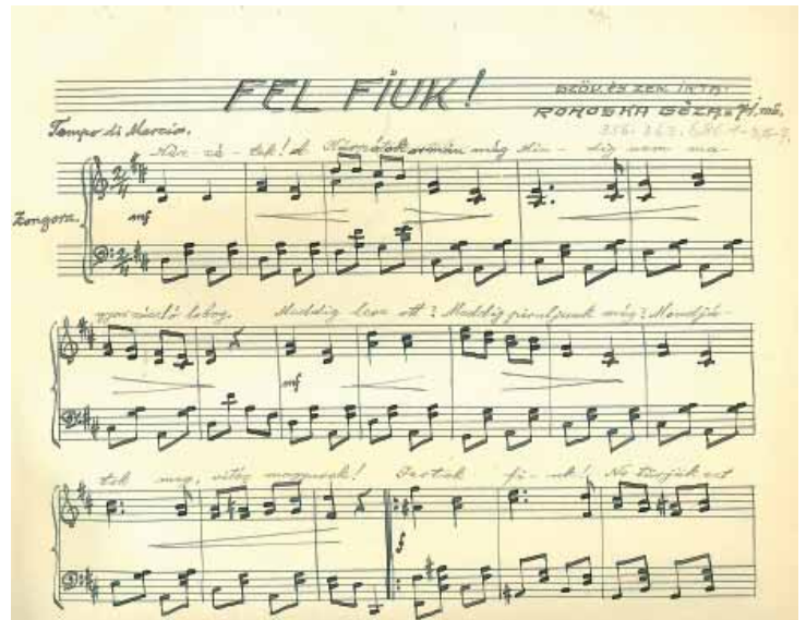
Egy hazafias dalának kottarészlete (1942)