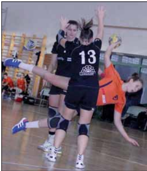
A lányok sikerét a fegyelmetett első félidei védekezés hozta meg

Az első pillanattól kiérdődött, hogy a két csapat között miért volt jelentős távolság a tabellán. A szarvasiak támadásban és védekezésben is meglepték a vendéglátójukat. A sárreítek tanácstalanságára jellemző, hogy edzőjük a 13. percre a második ide-