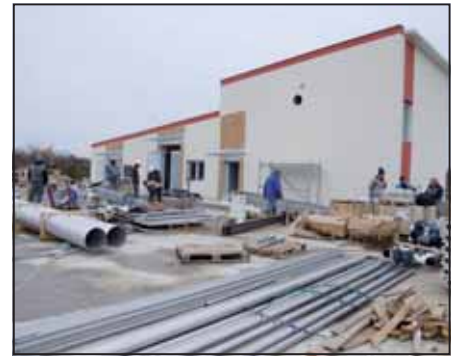
Az elektromos és a gépészeti munkák zajlanak

az érintett útszakaszok végleges helyreállítása. Az új szennyvíztelep építése is a befejezéshez közeledik, az elektromos és a gépészeti munkák zajlanak a napokban, ezt követi majd a telep körüli úthálózat megépítése. A hat hónapos próbaüzem február 28-án kezdődhet meg. A próbaüzem idején a kibocsátott szennyvízről kell bizonyítani, hogy annak paraméterei megfelelnek a vonatkozó szabályoknak és a telep szaghatása is előírás-szerű. Az új szennyvíztelep nagyságrendi előrelépést jelent Szarvas szennyvízkezelésében, s az új szakaszok megépülésével gyakorlatilag 100%-os lesz a város csatornázottsága. Az új szakaszokon a lakossági rákötés a minősítő eljárásokat követően kezdődhet meg, erről a kivitelező értesíti majd az érintetteket. Az