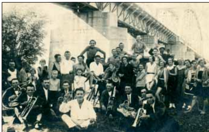
Rezesbanda az Élő-Körös hídjánál

Vagy például a harmincas években nagy divat volt – főleg az ifjúság körében – hétféveket a több napig tartó majálisszerű mulatság az Élő-Körösnél, a vasúti híd mellett. A mezőtúriak is kijártak ide. A háború alatt azután sajnos megszűnt ez a szokás.