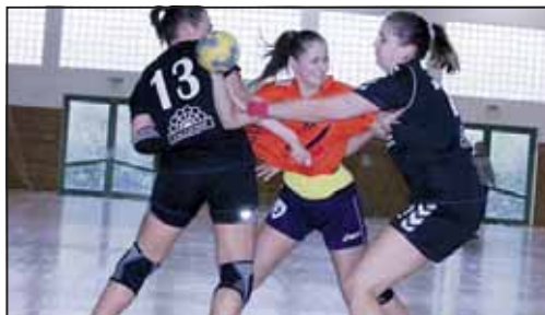
A szarvasi lányok harcosságát jól jellemzi a fotó