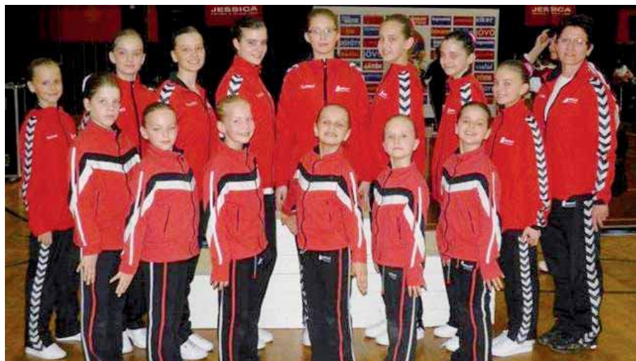
A Lendület SC fellépő versenyzői és edzője