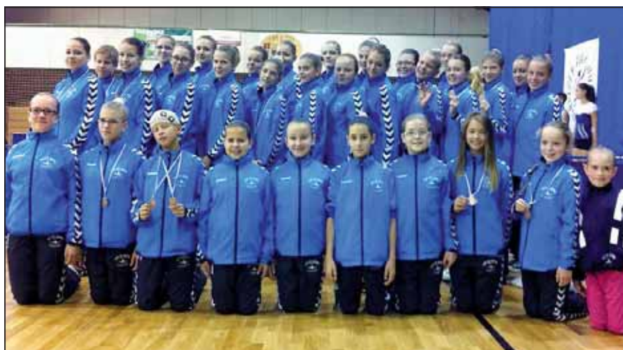
A Blue Gym létszámában is az egyik legnépesebb volt

– Már kora reggel elkezdődött a szendvicsgyártás, de a helyi büfének elhíresült a szülők által elkészített házi süteményekről, és a palacsintáról is, amiből rendre több száz elfogy egy ilyen napon. A versenyek díja-