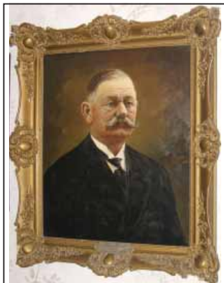
Id. Fehér József, Róth Béla olajfestménye

nőke volt, Róth Béla 5 fényképész-mester által készített festmény és a mestervizsgáról szóló oklevele most szobám falát díszíti. Működése idején sokat fejlődött a Testület. Amikor felszámolták az Ipartestületet 6 , minden pusztult, ebek harmincadjára került. Lehordták a padlásról a céhládákat, s azon versengtek, hogy ki tudja egy rántással széttegni a régi céhkönyveket. Ott voltak a régi tisztségviselőkről készített festmények is, mind odavesztek.