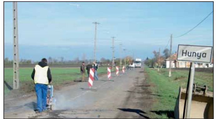
Hunyán kezdődött a nagyfelületű burkolatjavítás

több helyszínen is megjelennek a munkagépek. A program keretében megvalósuló munkák során mindenhol az út teljes szélességében valósul meg a felújítás.