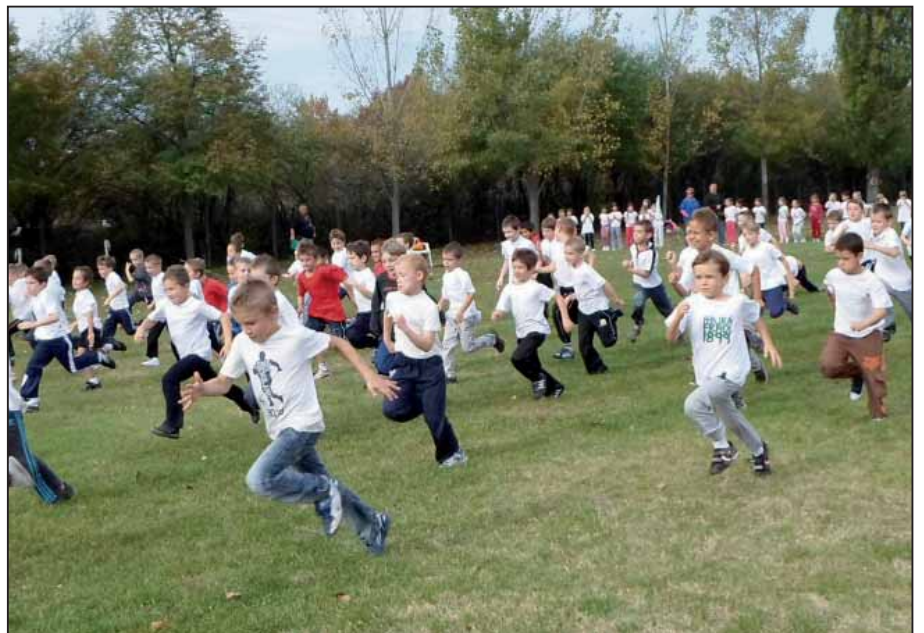
Rajt a legfiatalabbknál