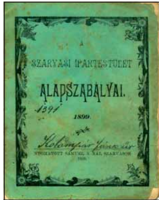
Az Ipartestület Alapszabályai, 1899-ből