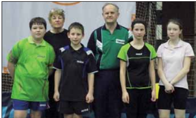
A Fest házaspár és néhány jeles tanítvány

A Szarvasi Körös ASE és az asztaltenisz szakkör hetedik alkalommal rendezte meg Körös Kupa asztaltenisz versenyt, amelyre népes mezőny gyűlt össze. A viadalon öt megye – Békés, Jász-Nagykun-Szolnok, Csongrád, Bács- Kiskun, Pest – 18 egyesületének, 78 játékosra ragadtott ütőt, és 12 versenyszámban küzdöttek a helyezésekért.