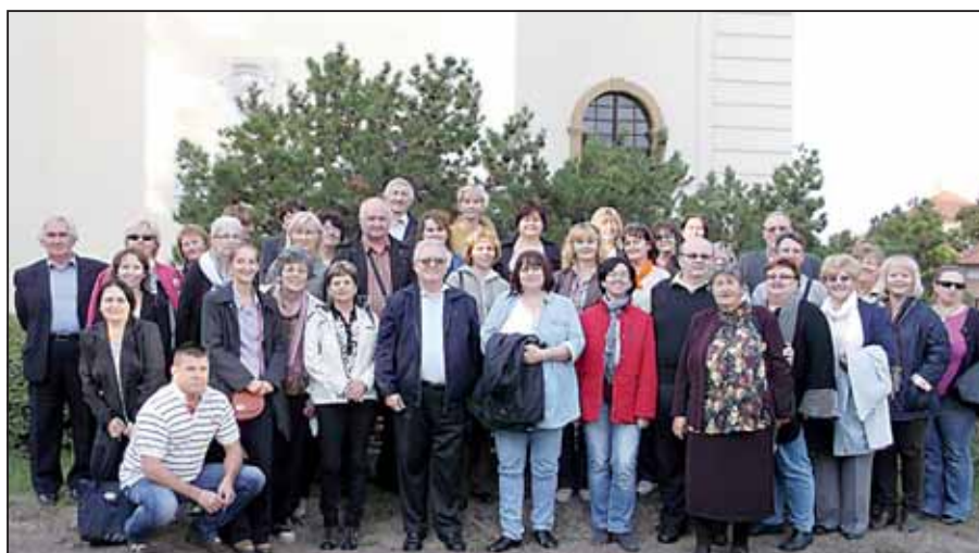
A konferencia résztvevői Tessedik temploma előtt