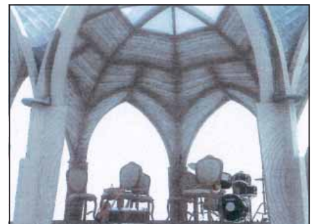
Zenepavilon látványtervek (tervező: Janurik György, társtervező: Nagy Gábor Sándor, látványterv: Nagy Péter)