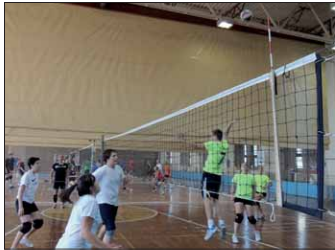
A küzdelmek három pályán folytak a Petőfi utcai csarnokban

A Szarvasi-Mix Röplabda Kupa végeredménye: 1. Alibi Delfinek (Budapest), 2. Six Team (Kecskemét), 3. Röplabdások (Izsák), 4. Árpád (Budapest), 5. Szarvasi (Szarvas – Bazsó