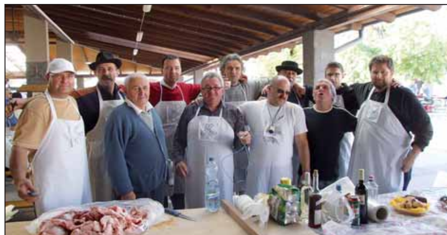
Utolsó fohász a nagy munka előtt a „dr. Mangalica és a Muslincák” csapatánál