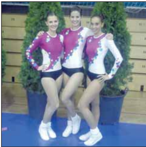
A Lendület SC felnőtt basic triója

A hétfégi debreceni Magyar Kupa fordulóval megkezdődött az aerobikosok őszi versenye. Az esemény már a harmadik fordulója volt a sorozatnak. A sportaerobikosok számára válogatás is szolgált a kétnapos rendezvény, a november 4-én kezdődő Európa-bajnokságra. Az első napon a step, challenge, basic kategóriákban mutatták be gyakorlatukat a különböző korosztályok képviselői, vasárnap pedig túlnyomó többségben a sportaerobikosoké volt a főszerep. A szezonnyitón természetesen mindenki ott volt, aki számít ebben a „szakmában” így a szarvasi Blue Gym és a Lendület SC versenyzői sem hiányoztak, mi több számos szép érmmel, illetve előkelő helyezéssel honorálták felkészítő-edzőik lelkiismeretes munkáját. A Blue Gym Aerobik Egyesület hat bronzérmes szereztek a különböző kategóriákban. A körülményekhez mérten a Lendület Sport és Szabadidő Club versenyzői is megtették a magukét, hiszen minden egységük sérülten mutatta be gyakorlatát, és egyik eset sem tréning köz-