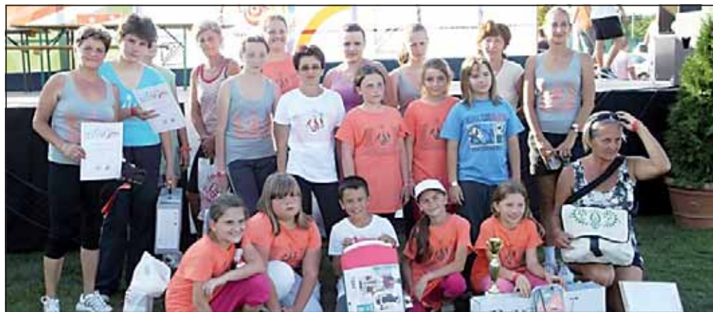
A megyei csapat sok szarvasi lányal-asszonnyal

A versenyszámok alatt párhuzamosan, az egészség megővésével kapcsolatos programok zajlottak, a pihenni vágyók pedig az egészséges életmód témában szaktanácsadások és fitsségi vizsgálatok közül választhattak.