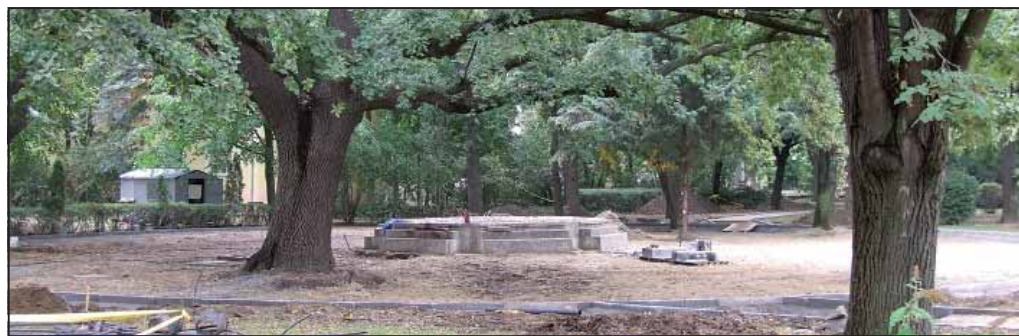
A leendő zenepavilon a Kossuth tér nagy tölgyfái alatt