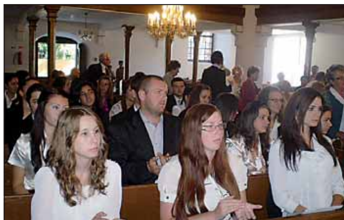
Az elsőéves hallgatók