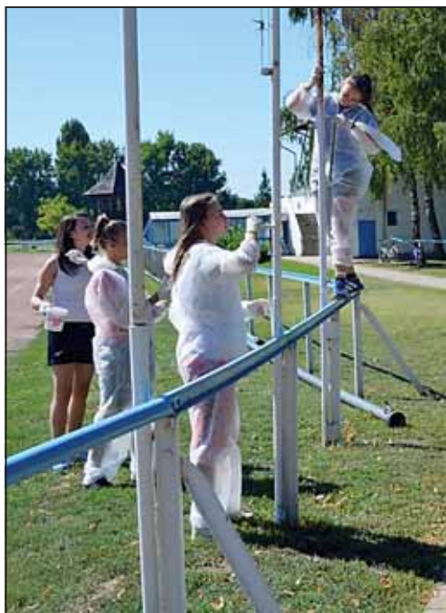
„Karitatív” festés a sporttelepen