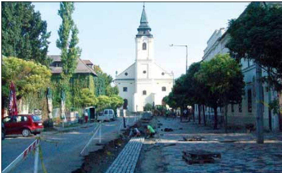
A Vajda Péter utcán már megkezdődött az új térburkolat lerakása