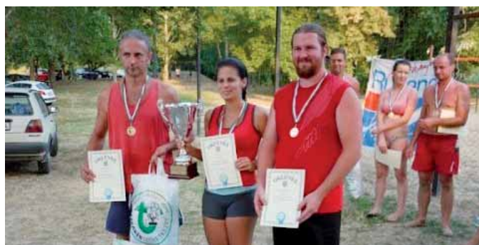
A győztes egység