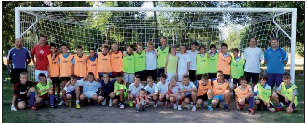
A jövő nemzedéke Szarvason