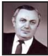
Felesége és családja