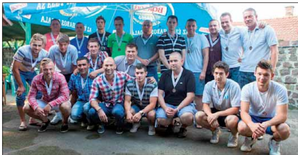
Az éremosztó évszázron készült közös csoportkép