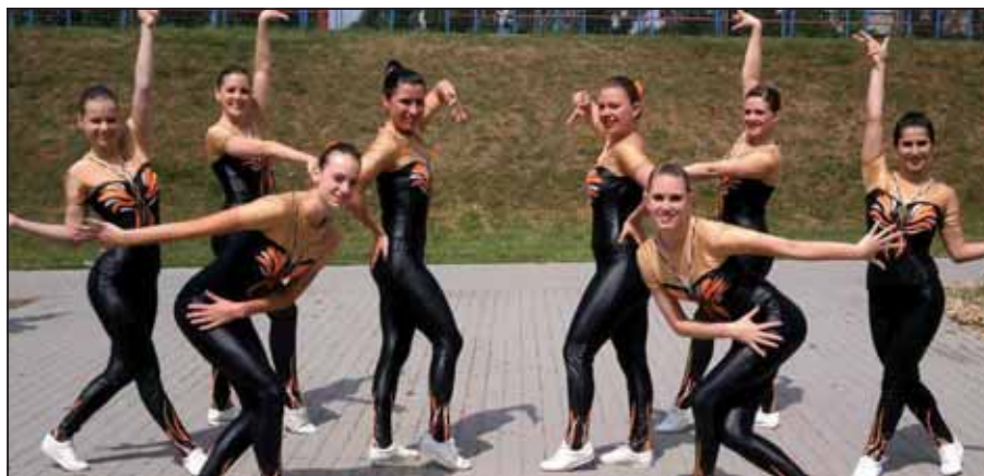
A Blue Gym bronzérmes aerodance csoportja