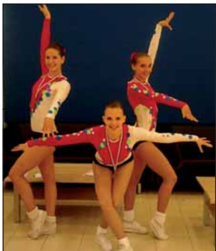
A Lendület SC felnőtt triója most debütált