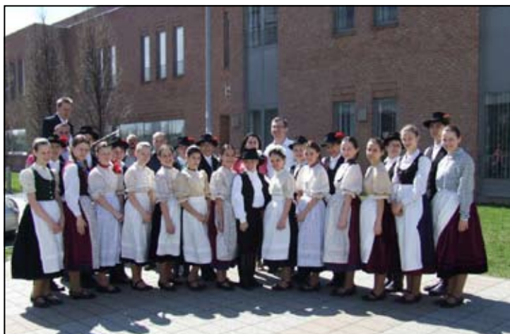
A különdíjas táncosok: Sköcök

Április 13-án, Budapesten szerepelt a Chován Kálmán Művészeti Alapiskola néptánc-csoportja a Sköcök, a néptánc-sok csoportos tanulmányi versenyének döntőjében. A zsűri