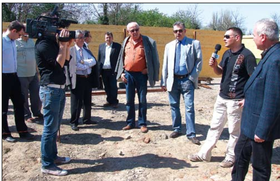
A piac leendő új kiszolgálóépületénél

A Kossuth tér Béke utca és Hatvan lakás közötti részén a játszótér felújítása szerepel a programban, ennek keretében új játszószerkezetek érkeznek a terre.