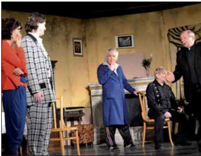
A felvétel nem a szarvasi előadáson készült.

Az expozíció a szokásos volt, a cselekmény csenden csordogált a mű medrében. Adott egy kegyeleti cikke árusításából élő, szolid-szelíd polgári család – papa, mama, leány, sógor, sógornő és egy káplán –, melyben eseménytelenül folyik az élet mindaddig, míg be nem toppan két idegen, akik közül az egyik alberletbe a családhoz költözik. Céljuk, hogy kifürkéssék, regényben megírják és nevetéssé tegyék a kicsinyes polgári életet – és persze rengeteget keressenek rajta.