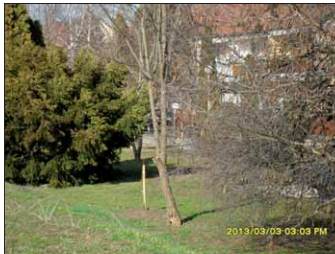
A Történelmi Emlékút két oldala

Posztív tapasztalatként említették a Körös utca elején történt fakivágás esetét: az elszáradt és kivágott fák törzsét és gallyait azonnal elszállították a helyszínről. V. Á.