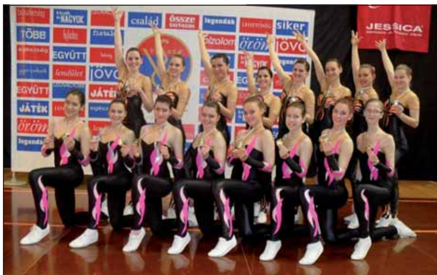
A második napi éremszállítók. Elöl Blue Gym első helyezett aranyérmes aerostep csoportja, hátul pedig az aerodances egység