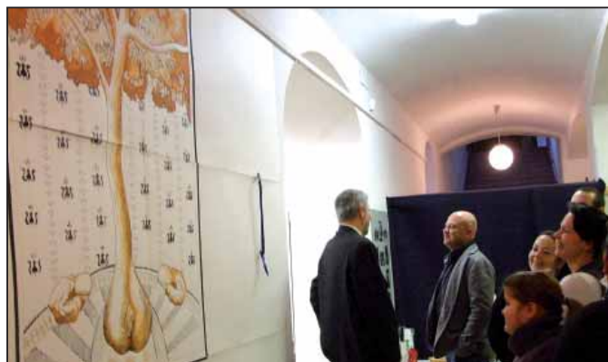
A múzeumba érkezőket fogadó nagyméretű alkotás

egyáltalán nem könnyű, kezdve azzal, hogy az alaplemezzel, a dúcra éppen a fordítottját kell megcsinálni annak, amit látni szeretnénk. Ezért aztán ez a műfaj letisztult folyamat, a művészettörténet hat évszázadában mindig is egyszerű és világos nyelven közölte a mondanivalót. Zsada alkotásairól úgy nyilatkozott Szuhaj György , hogy van mondanivalójuk, bár ez a kiállítás inkább a „lecke”