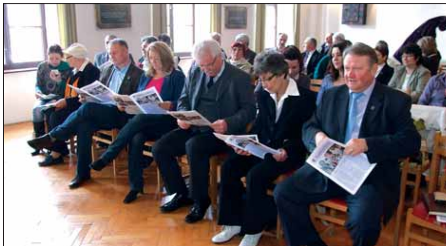
A vendégek a születésnapú Novinkárral ismerkednek