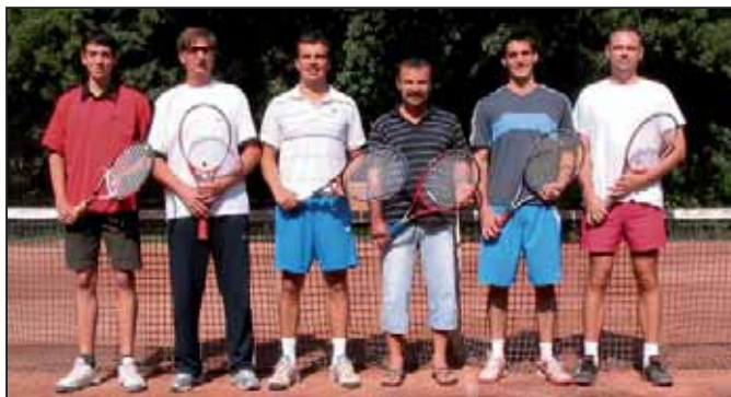
Egy korábbi fotó a szarvasi csapatról

Szeptember 7., szombat, 10.00: Szegeci VTC–Szarvasi TC I. Szeptember 8., vasárnap, 10.00: Szarvasi TC I.–Fővárosi Vízművek SK II. Szeptember 14., szombat, 10.00: Szarvasi TC I.–Rákosmenti TK-Fagyas Team II. Szeptember 15., vasárnap, 10.00: Ifjúsági Minigolf és Tenisz Egyesület–Szarvasi TC I. Szeptember 22., vasárnap, 10.00: Szarvasi TC I.–Szentesi Kinizsi SZTE