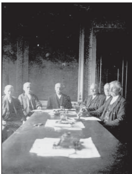
A régi fénykép előlről