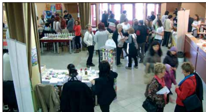
Akik „vevők voltak” a lehetőségre