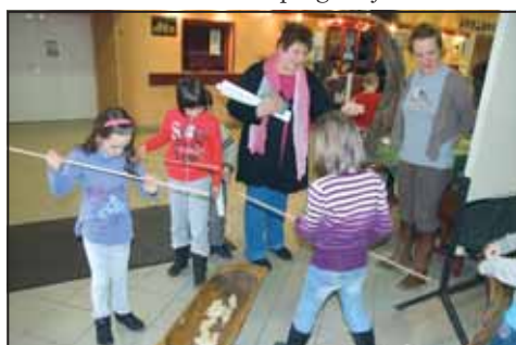
A Körös-Maros Nemzeti Park „standján”

A Víz világnapja alkalmából egész hétfévén kedvezményrel és érdekes programokkal fogadta látogatóit a Szent Klára Gyógyfürdő és a Vidám Szarvas Jégpálya. Bár az idő nem volt kedvező, a Szarvasi Arborétum is várta és fogadta az érdeklődőket a Víz Világnapja alkalmából rendezett programjain.