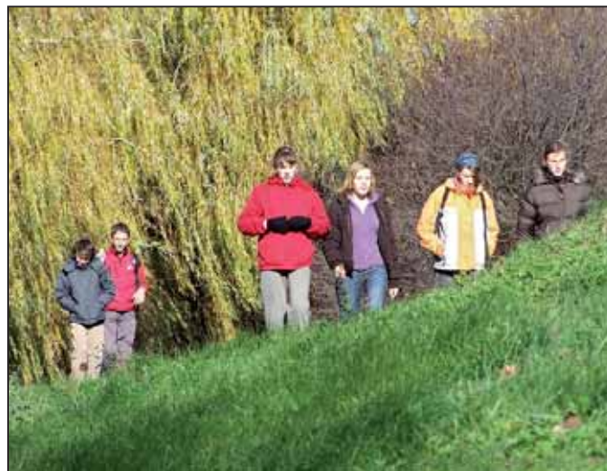
Kiváló idő fogadta a túra résztvevőit

rétum előtt volt felállítva. Akik ezt az útvonalat járták, akár a Pepikertben is látogatást tehetnek, ingyen és bérmentve. A kétszer ekkora utat választók pedig a komp és a szivornya érintésével a kiskgáton tértek vissza a kiinduló pontra. A célba érkezve minden résztvevő egy félárú jegyet kapott a korcsolyapályára, amit