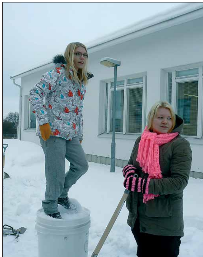
A hószobor készítésének első lépései

többször, akiknek nem okozott gondot a jeges lépcső és nem félt a magasságtól, ki nem hagyta volna. Amikor felértünk, majdnem beláttuk az egész városkát, valamint azt a rengeteg erdőt, amiben sétálgattunk a hótalpakon. Nagyon fáradtan értünk vissza az iskolába, viszont még várt ránk egy egész délután, amikor kipróbálhattuk a sífutást is. Nem sok társunk mert egyedül futni, hiszen előtte hármassával is álltunk a speciálisan három emberre kialakított léceken, melyeken nehezebb a mozgást összehangolni, azonban aki