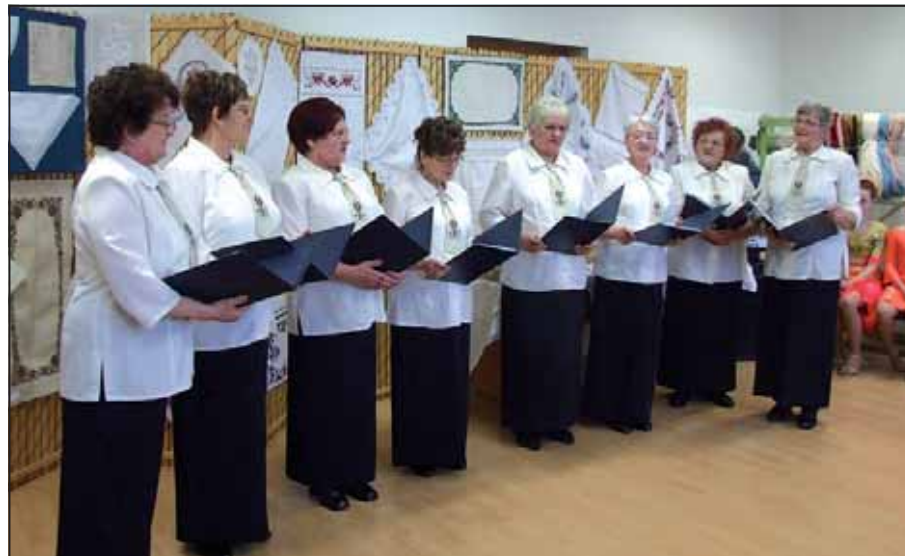
a Mozgáskorlátozott Egyesület kereteiben működő dalkör tagjai énekeltek el néhány népdalt

A hónap civil települése februárban Békésszentandrás a Damjanich utcai Civil