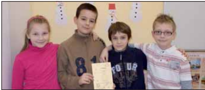
A Tudorkák csapata