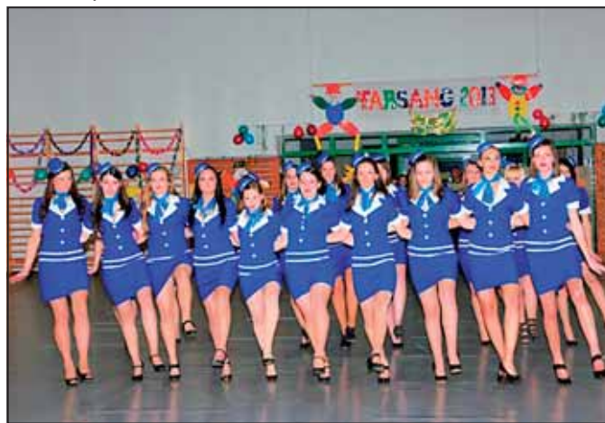
A légiés légikisasszonyok

Az idei farsang egyben új hagyományt is teremtett. Eddig a kisgimisek (a nyolc évfolyamos gimnázium tanulói) ünnepelték ezt a jeles télbúcsúztató eseményt, ettől az évtől a gimnázium valamennyi osztálya számára lehetőség nyílt a fellépésre. Bár ezzel csak a 12. B osztály élt, reméljük jövőre a többiek is kedvet kapnak egy kis bolondozásra.