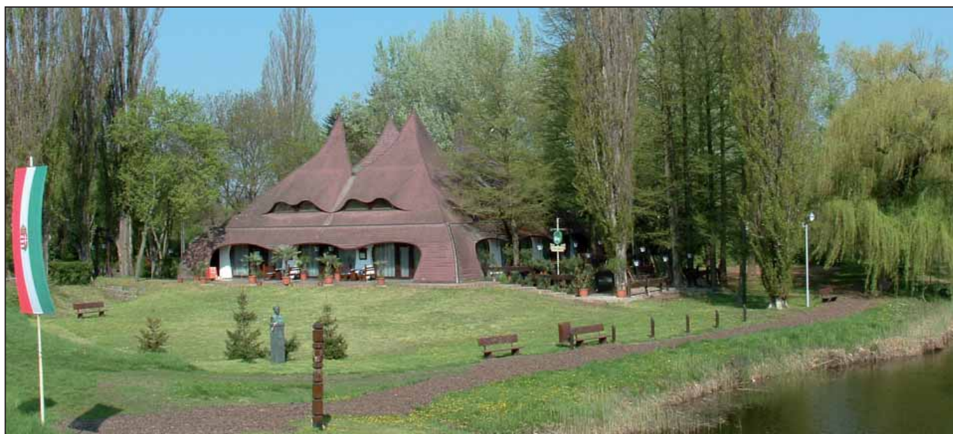
„A híd lábánál magasodó épület jellegzetes kupoláival a város egyik nevezetességévé vált.”