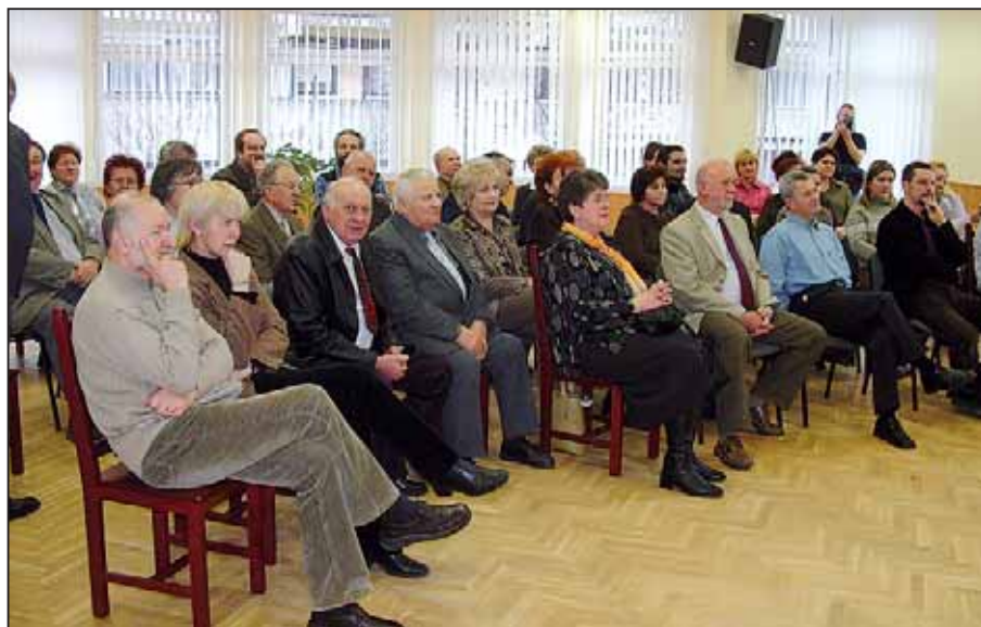
A szarvasi könyvbemutató közönsége

Hosszú a lista felsorolni, hogy bent a városban mi minden történt, mi minden épült és újult meg az elmúlt húsz év alatt. De jó érzés ezt számba venni, még ha nem is teljes a sor. A milicentenárium alkalmából felújították az Árpád Hotelt. Az épület a múltban is a település mezővárosi rangját képviselte, és most is Szarvas egyik büszkesége lehet. Megszépült vele szemben az egykori árvaház, ma iskola. Külsőjében az épület stílusához méltó tornatermet építettek. Megújultak a külső falai, és új tetőt kapott az egykori városháza, a Mitrovszky-kasztély. A Városi Fürdő éppen száz éves volt, mikor megkezdődött a felújítása, melynek befejeztével alkalmassá vált gyógyfürdőként funkcionálni, s nem utolsó sorban él-mény- és úszómedencével bővült ki.