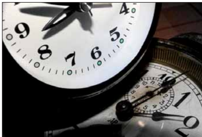
Bagi Dániel - Időkép