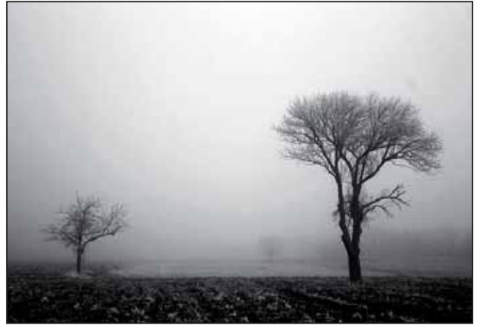
Diós Kristóf - Múlt Idő