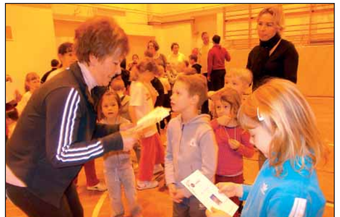
A versenyek hevében vidám zsvajj töltötte be a csarnokot

Negyedikeseink ügyesen segítettek az eszközök kiosztásában és az eredmények értékelésében a játékok közben.