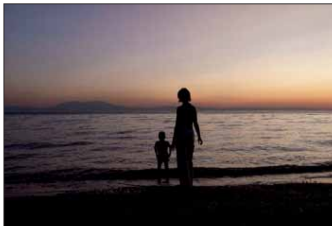
Bagi László - Együtt