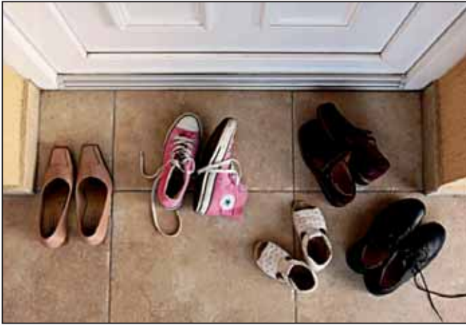
Basilides Kinga - Együtt