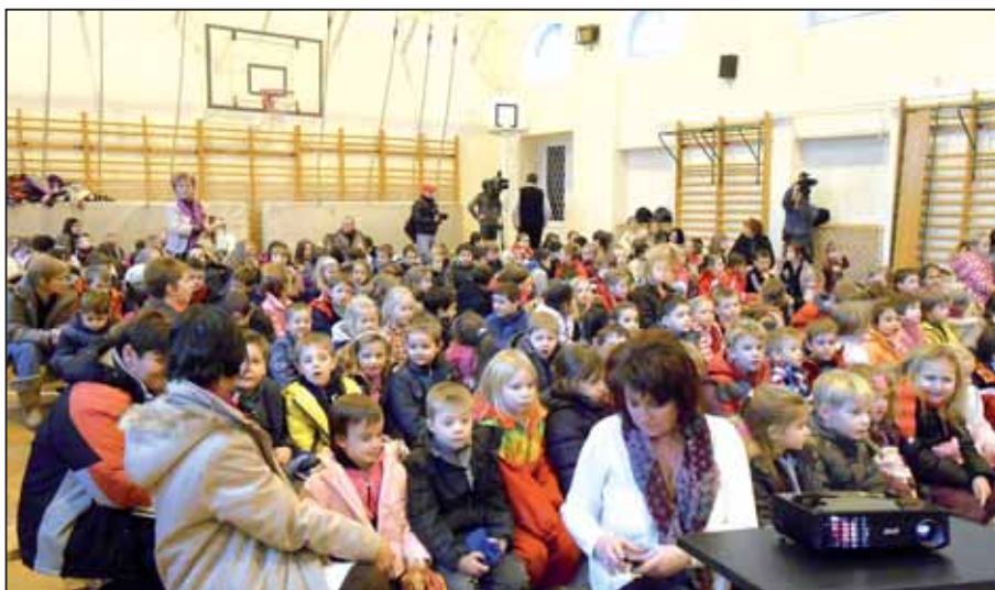
...képzeletbeli nézőterén pedig szarvasi kisdíákok