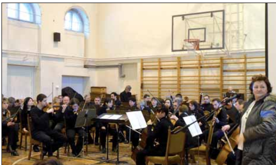
A tornaterem képzeletbeli színpadán a Szolnoki Szimfonikusok...

A pályázat kapcsán az iskolásainknak lehetősége nyílik egy éven át rendhagyó énekorákon keresztül tovább ismerkedni a kü-