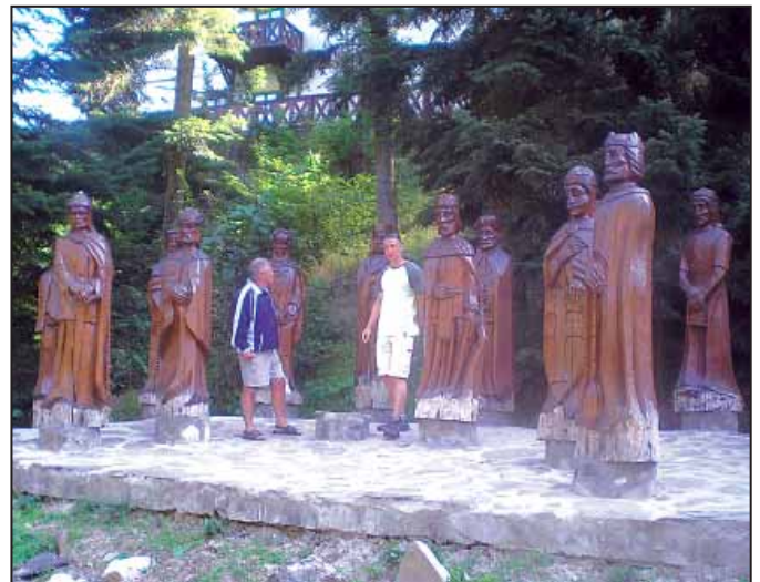
Magyarország történelmének jelentős személyiségei.