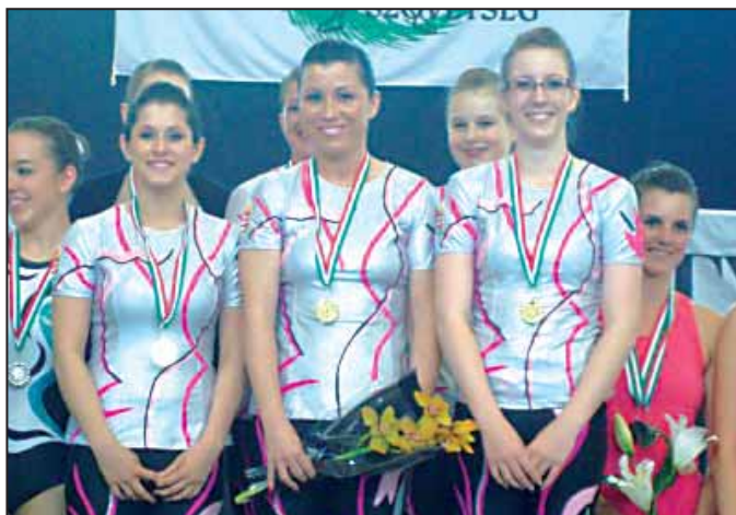
A szarvasi lányok idén már harmadszor állhattak a dobogó tetejére