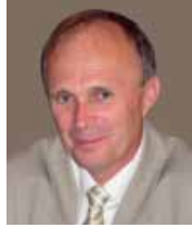
A gyászoló család

58. életében, gyógyíthatatlan betegségben elhunyt.