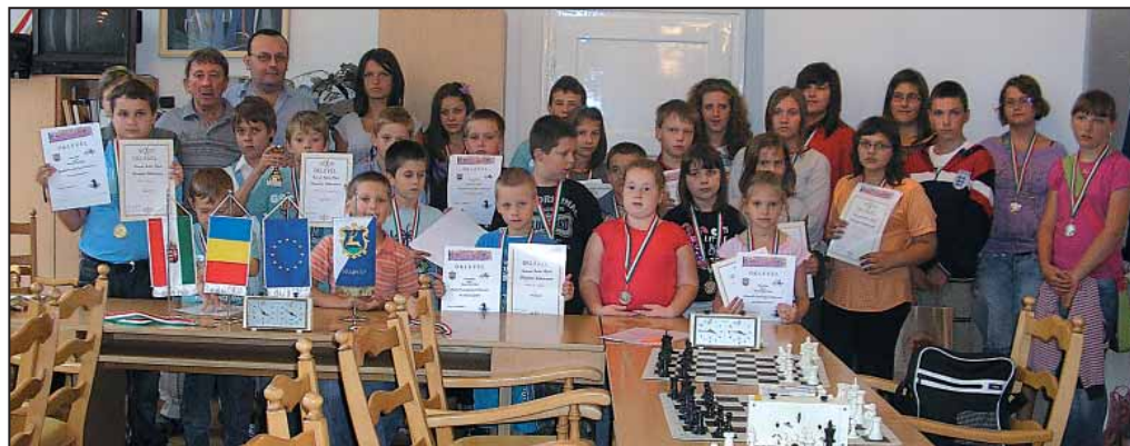
A meghívásos sakkverseny résztvevői