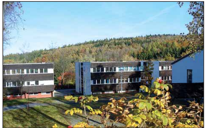
Szálláshely a német fogadóintézményben