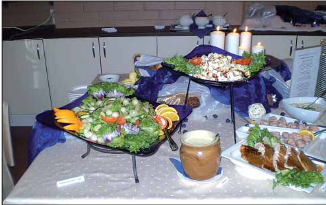
A finn fogadóintézmény konyháján

Ez év januárjában iskolánk három pályázatot nyújtott be az Európai Unió Egész Életen Át Tartó Tanulás Program Leonardo da Vinci Mobilitási programjára, mindhárom pályázatunk elnyerte a Tempus Közalapítvány támogatását mintegy 39.000 €, közel 10.5 millió értékben. A Leonardo mobilitási projektekben szakmai alapképzésben részt vevő tanulók vehetnek részt azzal a céllal, hogy a szakmai gyakorlatuk egy részét egy külföldi fogadó intézményben illetve vállalkozóknál töltsék. Ez alatt az időszak alatt a résztvevőknek alkalmuk nyílik külföldi munkatapasztalat megszerzésére, szakmai tudásuk és készségük fejlesztésére, valamint az idegen nyelv aktív gyakorlására.