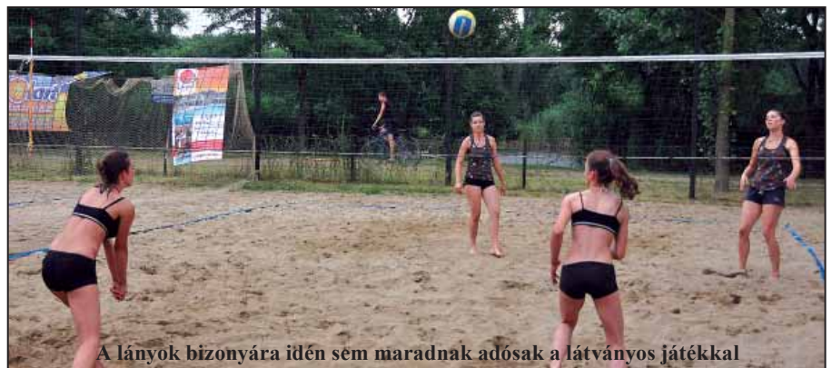
A lányok bizonyára idén sem maradnak adósak a látványos játékkal

Békés megyében 1998-ban rendeztek első alkalommal strandröplabda tornát. A sportág azóta komoly népszerűsége tett szert és a kezdeti nyári megyei bajnokság is regionális szintre emelkedett. A dél-alföldi strandröplabda bajnokság ideji nyitó fordulójának idén is Szarvas ad otthont július 2-3. között. Az eseményt a Kacsató partján megépített új pályákon rendezik, ahol három játéktér áll a résztvevők rendelkezésére. Ennek megfelelően a lebonyolítási rend is a tavaly bevált módi szerint zajlik: az első napon a férfi és a női párosok küzdelmeit tartják, vasárnapra pedig a vegyes párosok csatározásai maradnak. A meccsek mindkét napon reggel 9 órakor kezdődnek.