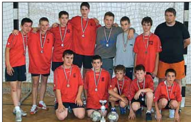
A szarvasi együttes