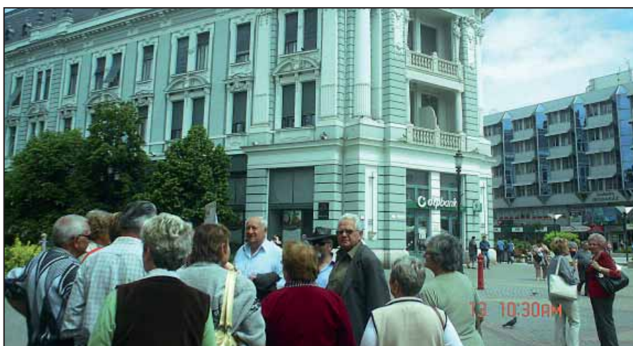
A szarvasiak megbeszélése Nyíregyháza főterén