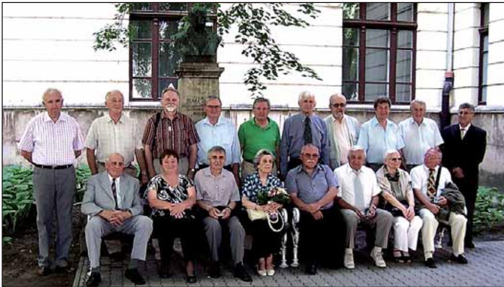
A szarvasi Ált. Vajda Péter Gimnázium IV. B osztálya 1957-1961