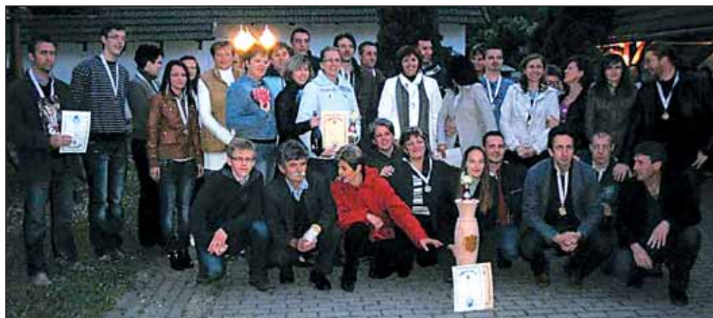
Idénzáró közös felvétel