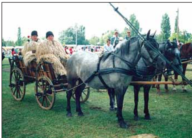
A bakon, a Lovas Világtalálkozón

2005. július 21-én nyílt meg Szarvason a III. Lovas Világtalálkozó, utoljára ekkor ültem bakra. Feleséggel úgy határoztunk, hogy a kocsiakat felajánljuk a szarvasi Tessedik Sámuel Múzeumnak. Értékes felajánlásomat elismerés követte, Szarvas Város Önkormányzata 2005. december 5-én a Szarvas Város Közművelődéséért díjat adományozta nekem. Örömmel töltött el a kitüntetés, bár sosem vágytam ilyen babérokra. A sajtóban is megjelentek hírek erről akkoriban. 1