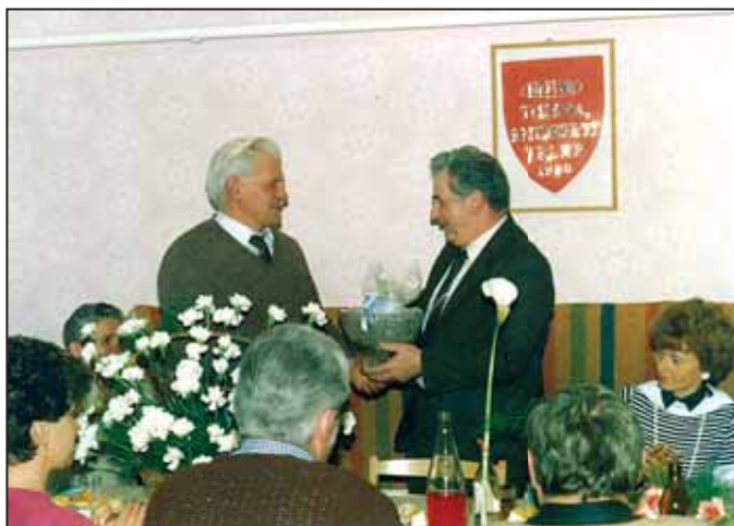
Búcsúztatása a MÉH vállalatnál, 1987 márciusában

Lekerültek a padlásról a szekérrészek, s napokig mást sem csináltam, mint összeállítottam és szépen rendbe hoztam a kocsiakat. A helyi lovasklub segítségével többször bemutatkoztam, felvonultam a kocikkal, a feleséggel együtt. Azóta többször elmentünk a hortobágyi lovasnapokra is.