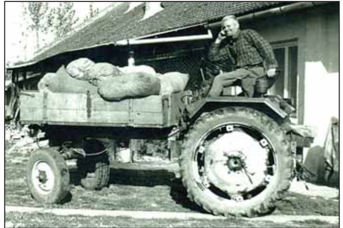
Az RS 09-esen, 1973 körül