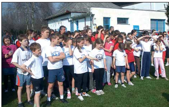
Rajtolnak a legkisebbek