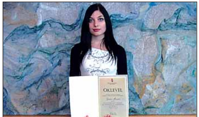
Merci az elismerő oklevéllel

seinek segítése, továbbá, hogy a diákok ápolják a fair play szellemiségét.