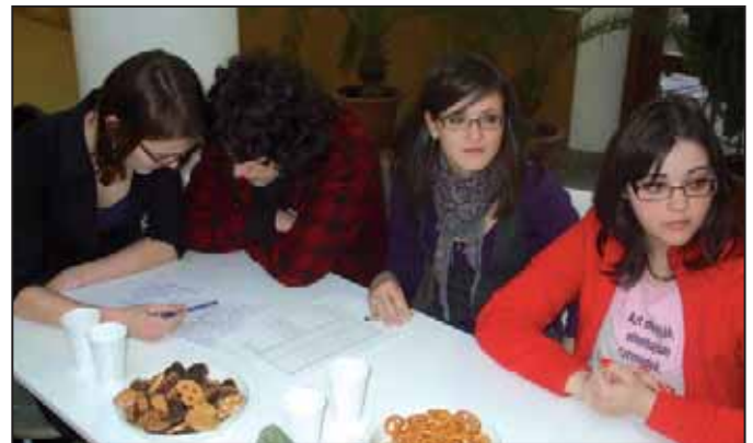
...és a két második helyezett csapat

tárgyi emlékeinek képről való felismerése), fogalmak, személyek és írott források megfajtése. Tavaly készítettünk először a kort bemutató filmrészletekhez kapcsolódó feladványokat – nagy siker volt – idén is bevetettük ezt a formát, sőt Vangelis