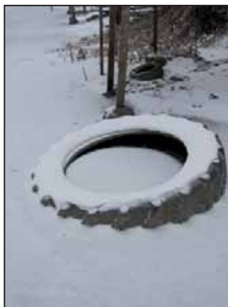
Csak akasztott ember nincs...