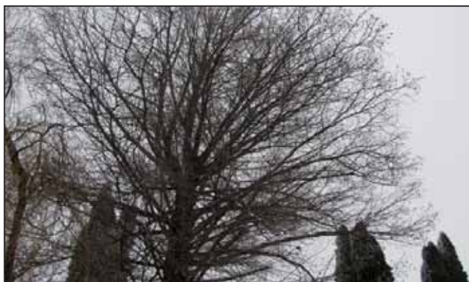
A természet grafikája

Február elején a Városszépítők néhány tagja szétnézett, mit is rejt a Körös nyári víztakarója.