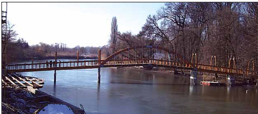
A gyalogos fahíd

INTEGRÁL Építő Zrt. végzi a befejezés időpontja 2011. március 15-e.