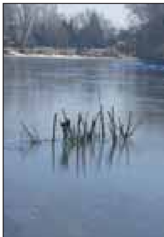
Ami élettér a süllőknek, életveszély az úszóknak