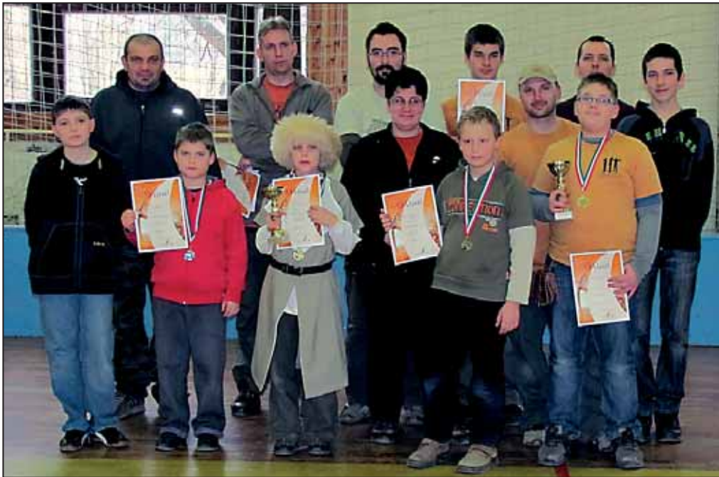
A szarvasi versenyzők népes tábora