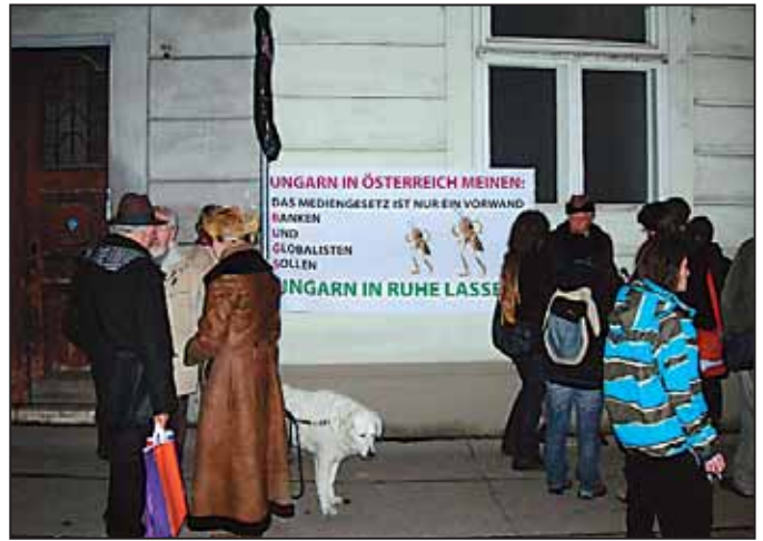
A transzparenst szövege: ausztriai magyarok véleménye szerint: a médiatörvény csak ürügy. Bankok és globalisták hagyják Magyarországot békében