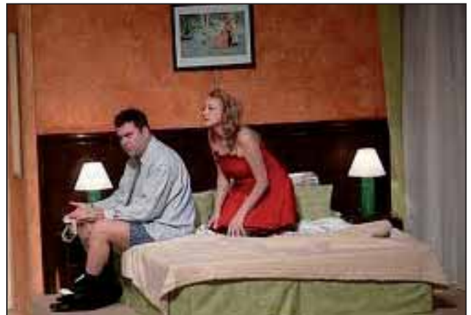
A felvétel nem a szarvasi előadáson készült

A szalon-drámák íróinak sikere pedig éppen ezekben rejlik. (Nekünk is van világsiker aratott szalon-dráma-írónk Molnár Ferenc személyében. Közel húsz színpadi művet írt, egy részüket – Liliom , Az üveg-cipó , Játék a kastélyban – ma is játsszák, de maradandó alkotása A Pál utcai fiúk lett és maradt.)