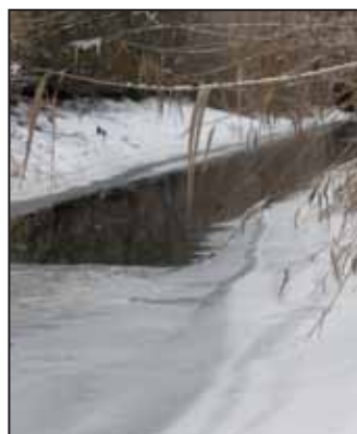
A Malomzugi csatorna torkolata