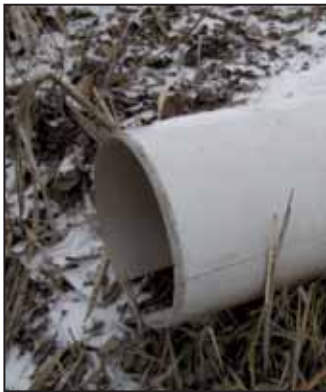
A Mangol csapadékvíz-elvezető rendszerének egyik beömlő nyílása. Most mindegyik száraz volt.

Elsőként a beömlőnyílásokat vettük szemügyre.