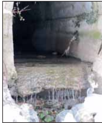
Nem így a több mint fél évszázada „üzemelő” városi csatorna, amelyből vígan csordogál a víz.