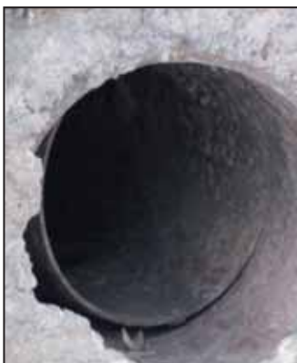
Egy a sok illegális „lyukból”