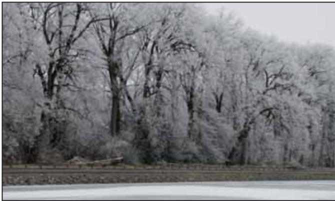
A város legnagyobb értéke és legszebb része a Pepi-kert és a Körös.

A Városszépítők néhány tagja végigjárta a Holt-Körösnek a fagyban láthatóvá és járhatóvá vált medrét a 44-es út hidjától a Malomzugi csatornáig. A látottakról folyamatosan, képsorozatban számolunk be.