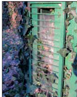
Először a védőüveget törték be