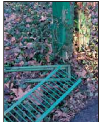
Végül ilyenek lettek

SZARVAS ÉS VIDÉKE Önkormányzati Hetilap Engedélyszám: HU ISSN 0238-1435 Megjelenik minden csütörtökön.