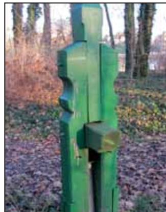
Ezután a rácsot feszítették le