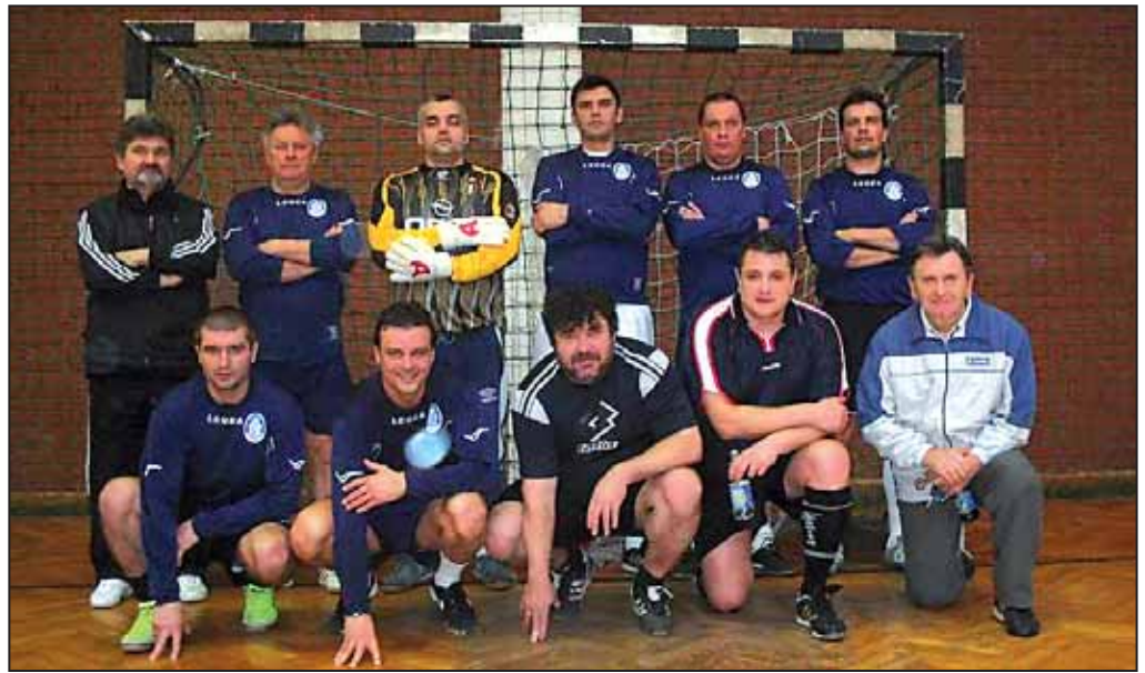
A tornagyőztes szarvasi együttes

– A torna idén is elérte célját, hiszen számos egykori játékosát, vagy ellenfelet sikerült pályára csalogatnunk, illetve a küz-