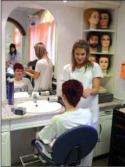
A fodrásztanulók versenyeken is sikeresek

Ehhez adottak a jól képzett szakoktatóink és a szakmában is elismerten, kiválóan felszerelt két tanműhelyünk. Itt vendégfogadás mellett és azon túl is gyakorolhatják a fodrász szakma elsajátítását. Az alapszolgáltatás ismeretein túl megtanulják a melegellős hajvágást, trendfestés, -vágást, gőzbúra használatot és a hajpótlást, hajhosszabbítást is.