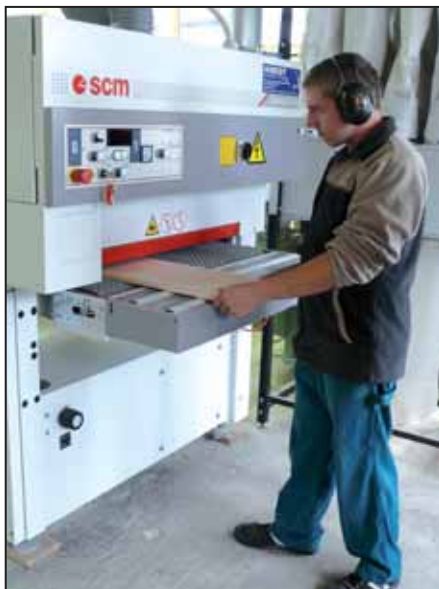
Munkában a kontaktcsiszológép

nulói létszám, és az, hogy 2009. év áprilisában mi rendezhettük meg a faipari technikus tanulók számára az Országos Szakmai Tanulmányi Verseny döntőjét. A verseny mind iskolánk, mind városunknak hatalmas megmérettetés volt, sikerét a jó kollektívának, szervező készségnek, és a mostanság egyre kevesebb helyen fellelhető együttműködésnek köszönheti.