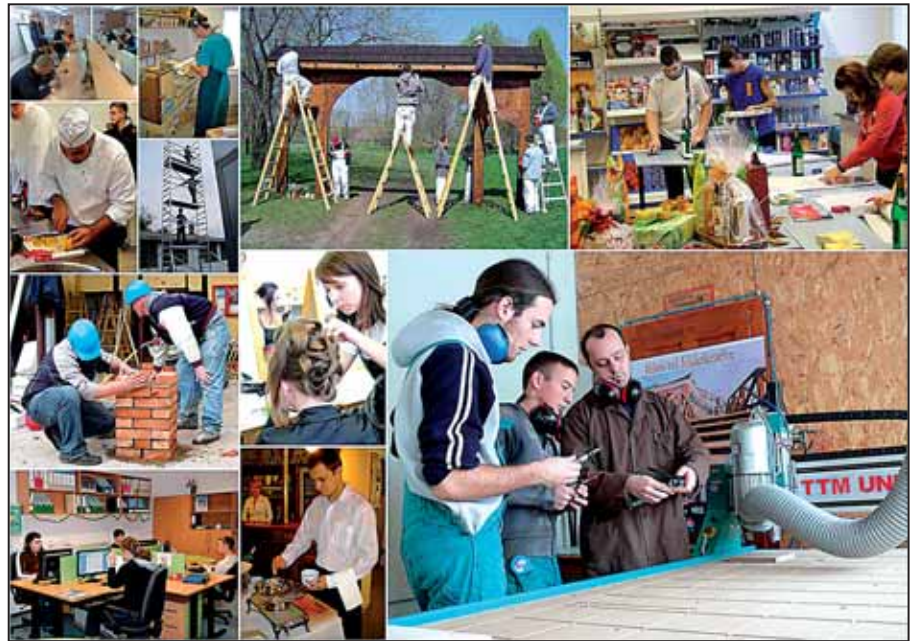
A szakképzés keretében 952 diák tanult, hat szakközépiskolai és hét szakiskolai szakmacsoportban

Különösen figyelemre méltó, hogy a szakma és az idegen nyelv gyakorlására nemcsak iskolai keretek között, hanem idegen nyelvetterületeken is adódott lehetőség. Azért is fontos ez, mert az oktatott szakképesítéseink többsége szolgáltató jellegű. Az élőmunka gyakoroltatása, a megrendelő-vel való kommunikáció fejlesztése elősegíti tanulóink önálló munkavállalásához vezető útjukat, nyelvi nehézségek feloldását. A vendéglátás, kereskedelem, fodrászat, ügyvitel, informatika szakmacsoportok szakképesítéseinél különösen kiemelt hangsúlyt helyezünk erre. A faiparban, építőiparban