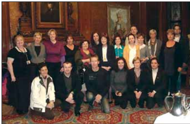
Glasgow-ban a partneriskolák képviselőivel és a város vezetőivel

Az egész napos feszített munka után este már kötetlenebb hangulatban tudtunk társalogni a vacsoraasztal mellett, mivel vendéglátó kollégáink gondoskodtak arról, hogy esztétiként idegenvezetéssel egybekötött városnézés után az általuk legjobbnak ítélt éttermekben választhassunk a francia konyha remekeiből és meg-