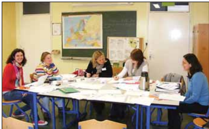
Pályázatírás Metz-ben, Franciaország

előkészítő látogatáson a franciaországi Metz közelében, Remilly-ben. Az ottani általános iskola vendégelte meg a résztvevőket, valamint vállalta,