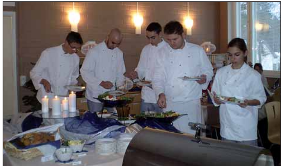
Főznek a vendéglősök