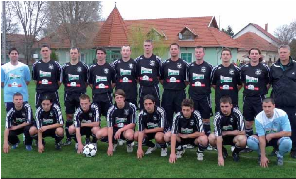
A Kondorosi TE őszi csapata

Mérlegen a Kondorosi TE labdarúgó-csapata