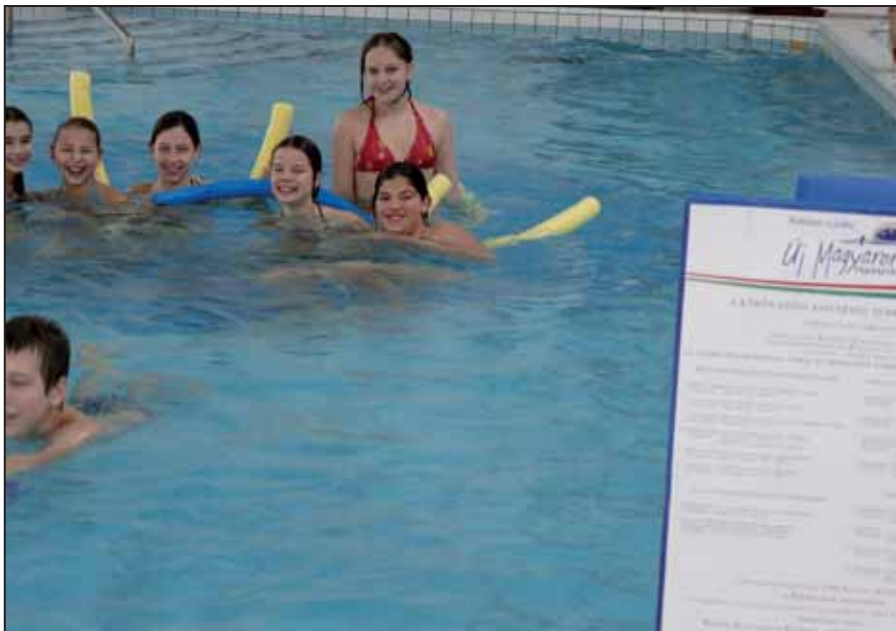
Vidám uszodai foglalkozás

Az együtt végzett tevékenység közösségformáló ereje pozitív hatással volt a gyermekek közérzetére. A program során nyilvánvalóvá vált, hogy a bevont korosztály nagy arányban érintett a mozgásszervi elváltozások valamely formájában. Ezért a gyermekek túlnyomó többsége bevonható és bevonandó a későbbiekben, kisebb csoportokban végzett gerincerősítő foglalkozásokba. Tapasztalataink azt mutatják, hogy további igény mutatkozik hasonló rendezvény lebonyolítására.