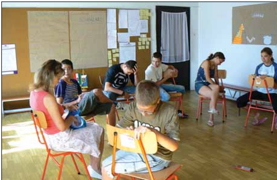
Lázás munka az Én-kép táborban

A célcsoportunkba tartozók többsége még iskolába jár, ezért felkerestük az általános- és középiskolákat, ahol az osztályfőnökök bevonásával minden osztályban meghirdettük programunkat. Elmondtuk a fiataloknak, hogy számos időtöltést kínálunk számukra heti két órában az év folyamán, ahol sok érdekes témáról hallhatnak majd, emellett lehetőségük nyílik kerekasztal-beszélgetésekre és kötetlen játékokra egyaránt. A gyermekek nagy érdeklődéssel fogadták kezdeményezésünket. Mivel a közöttük többen is vannak, akik iskola után céltalanul csellengnek a városban, sőt időnként az iskolát is elkerülik, számukra különösen fontos ez a lehetőség. Az osztályfőnökök, valamint a Családsegítő és Gyermekjóléti Szolgálat javaslatai alapján e problémás gyermekek szüleit személyesen is felkerestük, hogy felhívjuk figyelmüket programunkra. Kértük őket, hogy vegyenek