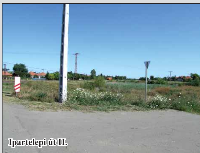
Ipartelepi út II.