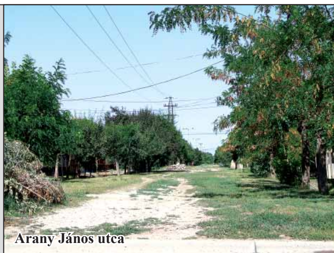
Arany János utca