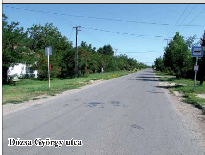
Dózsa György utca

Zárt csapadékvíz-elvezető csatorna építés a Jókai, a Petőfi, a Rákóczi, a Liszt Ferenc utcákban – ez a beruházás az Önkormányzati minisztérium támogatásával valósul meg. Bekerülés 155.555.600 Ft, támogatás 140.000.000 Ft.