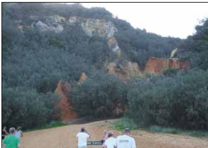
A Red Canyonnál

vissza a 75 mérföldes parton a Red Canon -hoz: fantasztikus nap volt. El tudnánk képzelni öreg napjainkat itt, csak kellene hozzá nyerni a lottón.