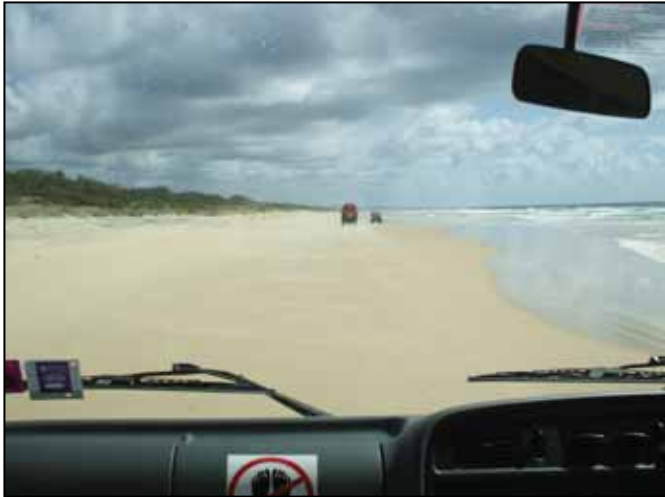
“Tengerparti országút” a Fraser szigeten.

Befizettünk a világörökség listás Fraser szigetre is. Terepjáró busszal a tengerparton végig: mivel nincs út. Ez a tengerparti út 125 km hosszú. A sziget közepén, az édesvízű Mc Kenzie tó fehér homokfövenyén fürdés-napozás, BBQ, sör, kávé, esőerdő, majd