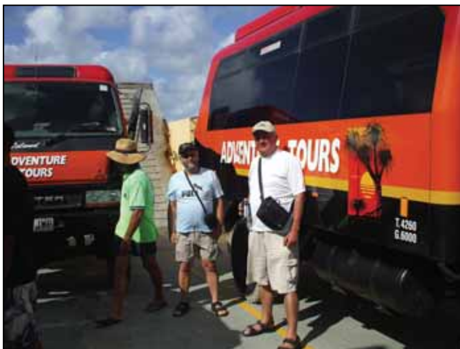
A kompon - útban a Fraser szigetre

vissza a 75 mérföldes parton a Red Canon -hoz: fantasztikus nap volt. El tudnánk képzelni öreg napjainkat itt, csak kellene hozzá nyerni a lottón.