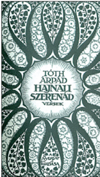
Első kötetének címlapja

Tóth Árpád a XX. század egyik legnagyobb formaművésze, e téren egyenrangú Babitscsal vagy Kosztolányival. A Nyugat első gárdájához tartozott. Költészete már egész fiatal korától a szomorúság emelkedett hangú kifejezése; kezdettől végig a fájdalom, a szeretetre, a boldogságra hiába váró ember szétáradó szomorúsága. Ezt a bánatot azonban pompásan zengő, gondosan csiszolt formában fogalmazza meg. Nem is írt túl sok verset, költői életműve mennyiségileg