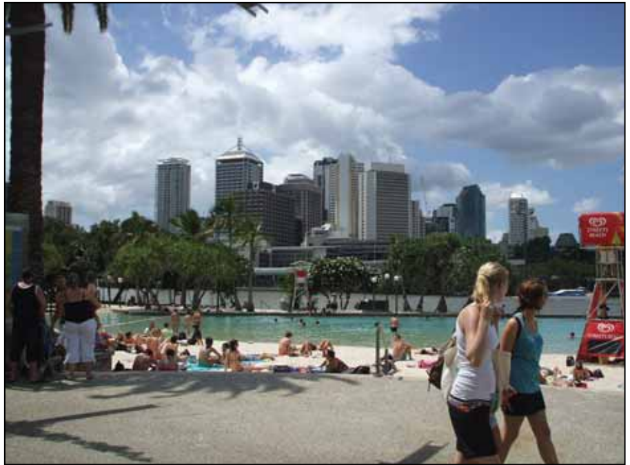
Brisbane, Streets Beach