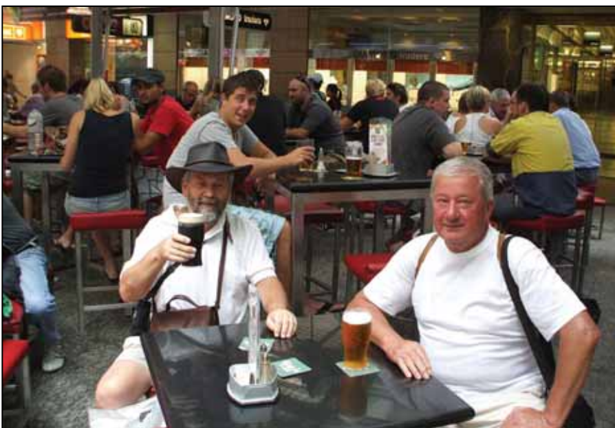
Guinness a Queens Streeten