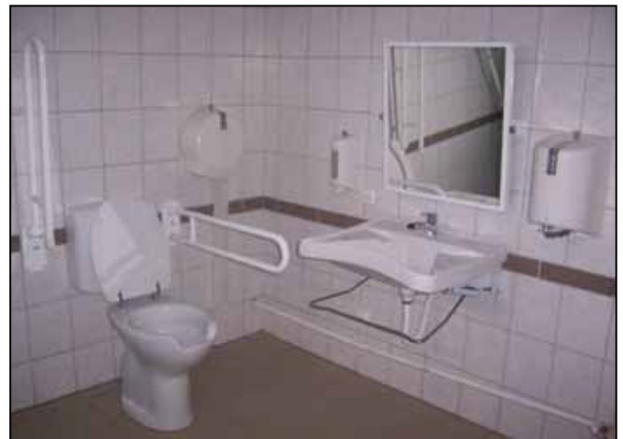
Megújult az akadálymentes fürdő is

2008. december 3-án történt meg a munkaterület átadás-átvétel, mely eljárásról külön jegyzőkönyv készült. Megtörtént az udvari kapu cseréje, a bejáratig vezető út akadálymentesítése. Az épület elé akadálymentes díszburkolatos parkoló és járda került, megújult a fürdő, a társalgó, klubszoba,