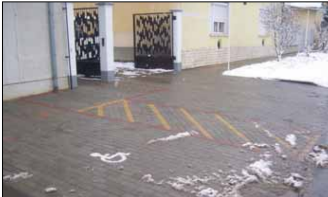
Az épület előtt díszburkolatos akadálymentes parkoló létesült. A korábban aszfalt burkolatos járda is díszburkolatot kapott az udvaron

pihenő és az orvosi szoba ajtószárnyait aszimmetrikus kialakításúra cserélték le. A szélfogó