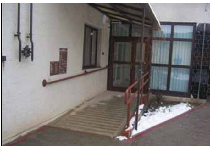
Az udvari rész is megközelíthető akadálymentesen

Összességében elmondható, hogy a XXI. századi elvárásoknak megfelelő, akadálymentesített épület várja ezennel Kondoroson az időseket, várhatóan a használók nagy megelégedésére.