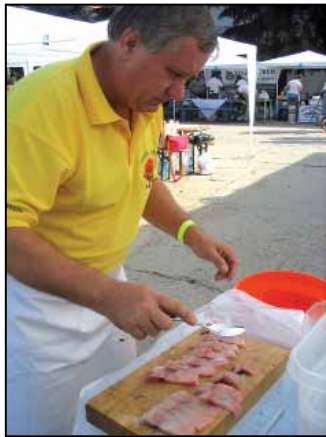
Már így is ínycsiklandó