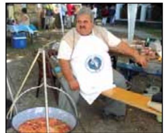
Túl a nehezén