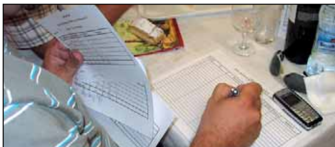
Harag és részrehajlás nélkül: pontoz a zsűri