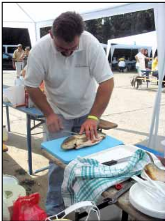
Ez is a halfőzéshez tartozik