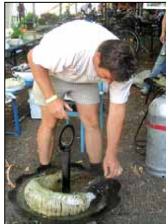
Készül a műemrek