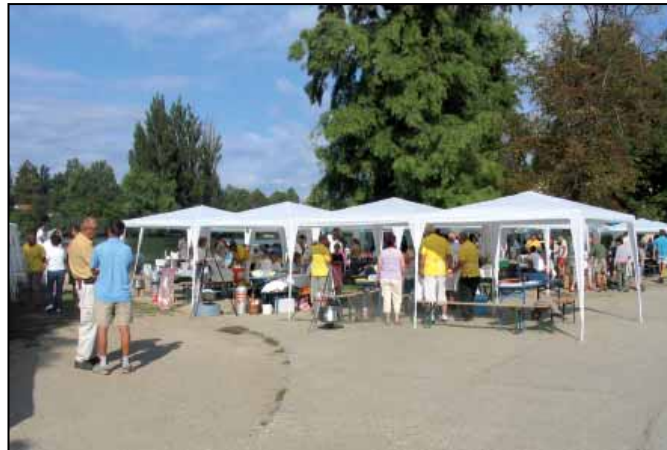
54 nevező, közel ugyanannyi sátor

Az összeállítást szerkesztette és a fotókat készítette: Kutas Ferenc