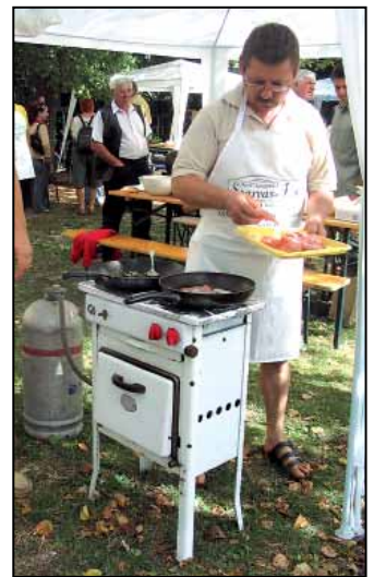
Antik darab, különleges halétel készül rajta