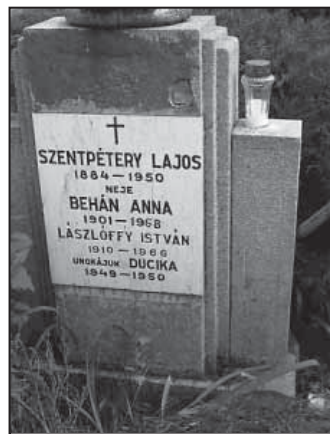
Síremléke a szarvasi Újtemetőben, a halálozás évszáma téves

A Békés Megyei Ügyészség 1957. Bül. 133/11. számú vádirata.