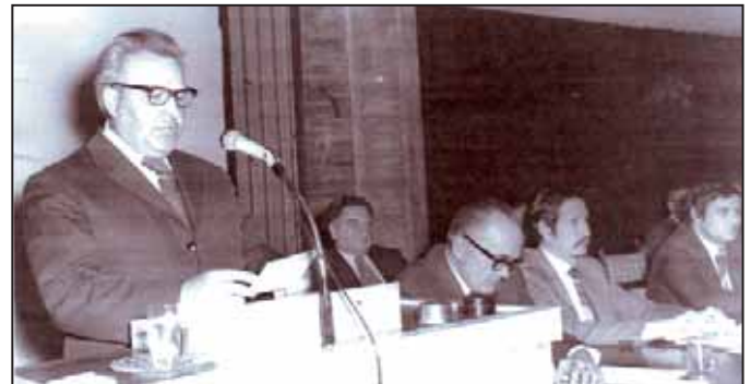
Felszólalás a METESZ országos küldötttertekezletén végül nyugdíjazásomig elnöke voltam. Tagja lettem a Megyei Ta-

Korán bekapcsolódtam Békéscsaba és a megye társadalmi életébe. 1960-ban alapítottuk meg a METESZ-t a Műszaki Tudományos Egyesületek Szövetségét, melynek alelnöke, később titkára,