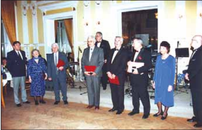
A Szarvasért emléklapok átvételekor a Baráti Köri bálón (2000)

1949-ben nősültem, szarvasi szabó kisiparoscsládból származó lányt vettem feleségül. Két lányunk született, az idősebb gyermekorvos Kecskeméten, férje születés. Ikergyermekük vannak, egy lány és egy fiú, már felnőttek, a lány közgazdász, a fiú unokám pedig építész-mérnök. A fiatalabb lányom kétdiplomás tanár, Dunakeszi város pro urbe kitüntetésben részesítette. Férje programtervező matematikus, sokat dolgozott külföldön. Itt is két unokám van, egyikük tanári diplomát szerzett és Pesten dolgozik, a kisebbik unokám pedig gimnazista. Gyermekünk, unokáink nagyon sokat jelentenek számunkra, segítenek, támogatnak; s bár távol vannak, napi kapcsolatban állunk velünk.