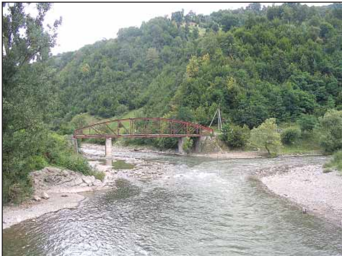
Rahó. Innen Tisza a Tisza. Balról a Fekete-, jobbról a Fehér-Tisza