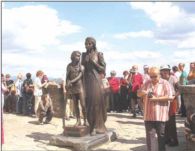
Zrínyi Ilona és fia, a későbbi II. Rákóczi Ferenc a munkácsi várban

6. (befejező) rész: Ami a szövegből kimaradt